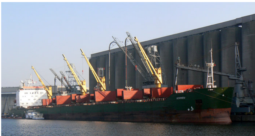
Deel 3 Fietstocht. Het Sifferdok te Gent-Zeehaven, hier begon de grootschalige uitbouw van de Gentse haven na 1960.

Zondag 29 Juni 2008 14 u station Wondelgem, zie blz. 8