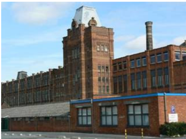
Wandeling 2 Vynckier-Vyncolyte, schoolvoorbeeld van vroeg hergebruik van spinnerijen langs de Verbindingsvaart te Gent.

Zowel tram 4 als bus 5 stoppen aldaar. Geen nood als u deel één (over de haven vanaf de middeleeuwen tot het eind van het ancien regime) gemist hebt. Elk deel van de SIWE-triptiekwandeling vormt een zelfstandig en autonoom verhaal. De nadruk in dit luik zal liggen op de ontwikkeling van de haven in de periode 1800 tot 1950.