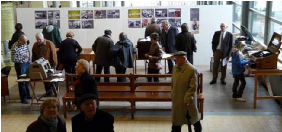
De SIWE-tentoonstelling "Industrie en wetenschap 1950-1970 in "Tweebronnen" te Leuven werd tijdens de Erfgoeddag op 13 april 2008 zeer druk bezocht !