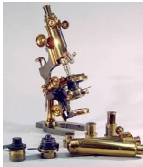
Foto Microscop Van Heurck. Museum voor de Geschiedenis voor de Wetenschappen